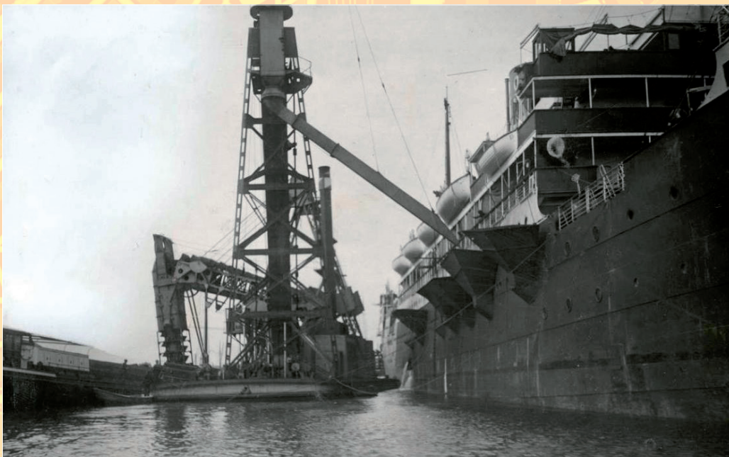
Op de vorige foto stond de Javakade, rond 1928 afgebeeld.

Mail je antwoord naar info@buurtbalie-ohg.nl . Insturen kan tot 15 juli. ZB45 biedt de winnaar een introductie 3D Printen aan.