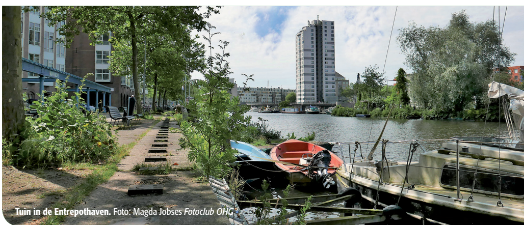
Tuin in de Entrepothaven.

Zaterdag 8 juli is het tweede Eesterfestival. Er zijn gevarieerde activiteiten voor jong en oud, waaronder een Duurzaamheidsmarkt. Hier laten bewoners hun initiatieven en ideeën zien voor een duurzaam OHG. Van zonnepanelen, warmtevoorziening, kruidentuinen tot de bijzondere drijvende tuinen die in de Entrepothaven liggen.