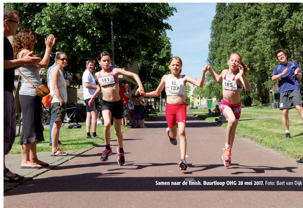
Samen naar de finish. Buurtloop OHG 28 mei 2017.

Op de laatste zondag van mei heeft de 3e editie van de Buurtloop OHG plaatsgevonden. Met het goede weer en een record aantal inschrijvingen is het weer een prachtige dag geworden. Vol enthousiasme begon de dag met de fanfare van Accu, gevolgd door de warming-up van de kinderloop door Leefstijl fysiotherapie. De kinderloop werd officieel geopend door Thijs Reuten van Bestuurscommissie stadsdeel