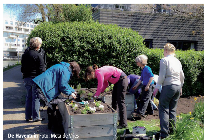
De Haventuin

de zoals wijnruit, rode pimperl en akeleiruit. Ook worden er wat groentes gekweekt, staan er een fruitboom en bessenstruiken. De tuinen zijn een rijk bloeiend geheel. Veel insecten en vlinders komen op de geuren af. De tuin en worden door buurtbewoners onderhouden. Elke eerste zaterdag van de maand wordt er 's morgens gezamenlijk in gewerkt. Iedereen die zin heeft om mee te tuinieren is van harte welkom.