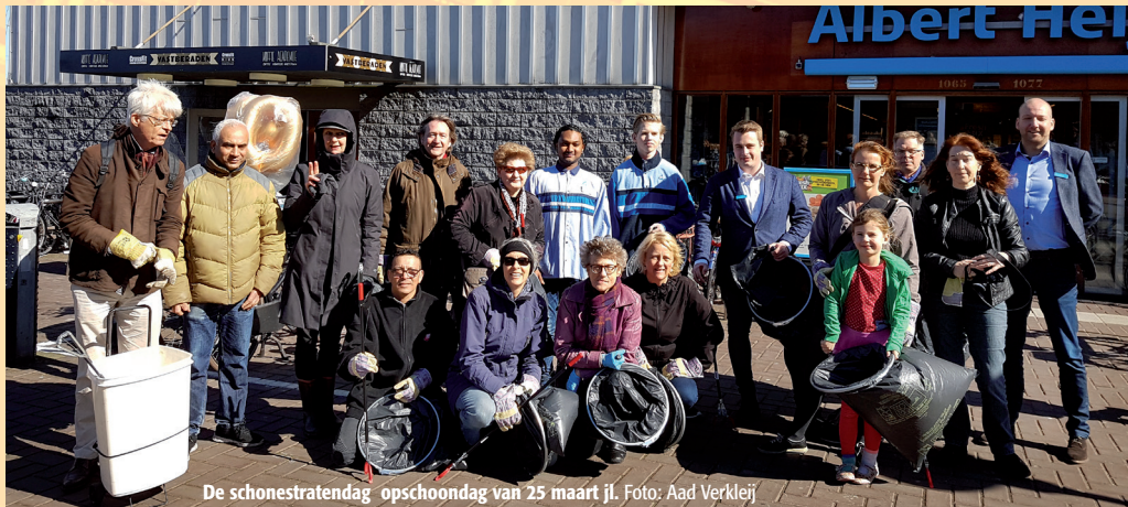
De schonestratendag opschonondag van 25 maart jl.

Elke eerste zaterdagmiddag van de maand verzamelt om 14 uur een groep enthousiaste buurtbewoners zich bij de Eester. Met handschoenen, prikkers en zakken gaan ze twee uurtjes op pad om een stuk van de buurt schoon te maken. De groep kan niet groot genoeg zijn.